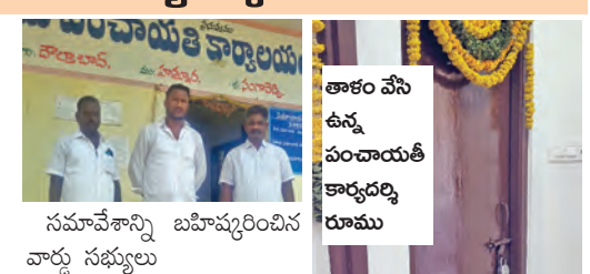
సమావేశాన్ని బహిష్కరించిన వార్డు సభ్యులు

హత్తూరు మండలం మేజర్ గ్రామపంచాయతీ దొల్తాబాద్ కు రెగ్యులర్ పంచాయతీ కార్యదర్శిని నియమించాలని గ్రామస్థులు డిమాండ్ చేస్తున్నారు. మేజర్ పంచాయతీ దొల్తాబాద్ పంచాయతీ కార్యదర్శిని, పక్కనే ఉన్న హత్తూరు గ్రామ పంచాయతీకి ఇంచార్జిగా నియమించారని, ఇక్కడ మాత్రం వారానికి ఒక గ్రామపంచాయతీ కార్యదర్శి వచ్చునని ఇన్చార్జిగా వచ్చి పోతున్నారని దీనివల్ల స్థానిక ప్రజలకు సమస్యల పరిష్కారంలో ఇబ్బందులు ఎదురవుతున్నాయని వారు ఆరోపిస్తున్నారు. తమ గ్రామపంచాయతీ కార్యదర్శి మాత్రం పంచాయతీ అంతర్గతం అవుతుంది వారు సంబంధిత అధికారులను ప్రశ్నిస్తున్నారు. ఇప్పటికే ఈ విషయాన్ని మండల, జిల్లా అధికారుల దృష్టికి తీసుకెళ్లగా, ఇన్చార్జి కార్యదర్శులను నియమిస్తున్నారో తప్ప, తమకు తేటాయించిన కార్యదర్శి మాత్రం ఇక్కడికి పంపించడం లేదని వారు ఆరోపిస్తున్నారు. పరిష్కారం పంచాయతీ కార్యదర్శి రూముకు తాళం వేసి ఉంది, తమ పనులపై వచ్చే ప్రజలకు సరైన సమాచారం చెప్పేవారు లేకుండా పోయారని వారు