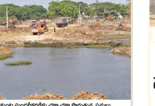
కోమటికుంట సుందరీకరణకు చలా చేసా సాగుతున్న పనులు

మున్సిపల్ వైర్లను మామూలు లక్షి గుర్రాబా యాదవ్.. నర్సాపూర్ పట్టణానికి మంజూరైన 15 కోట్ల నిధులతో పట్టణమంతా అభివృద్ధిని చేసి జిల్లాలోని నర్సాపూర్ పట్టణాన్ని ఆదర్శవంతంగా తీర్చిదిద్దతానున్నారు. ఇందులో భాగంగానే కోమటికుంట సుందరీకరణకు కోటి 20 లక్షలు నిధులతో అధునిక హంగులతో కోమటికుంటను అన్ని పనులు కల్పించి అభివృద్ధి చేస్తానని మున్సిపల్ వైర్లను లక్షి గుర్రాబా యాదవ్ వెల్లడించారు.