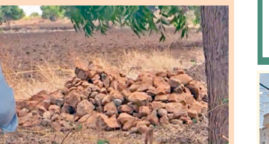
భర్త ముత్యంరెడ్డిని పాతిపెట్టిన దృశ్యం