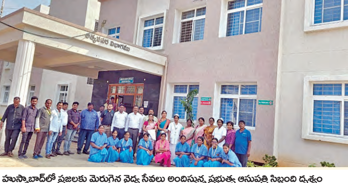
హుస్సాబాద్లో ప్రజలకు మెరుగైన వైద్య సేవలు అందిస్తున్న ప్రభుత్వ ఆసుపత్రి నిర్మాణం దృశ్యం