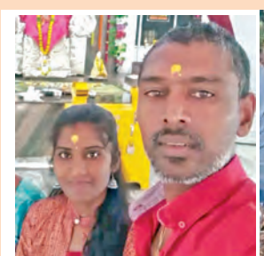
ప్రయోజనం కోసం కలిసి మృతదేహ భార్య