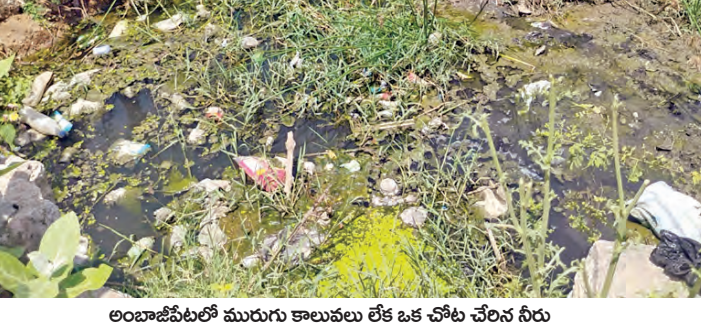
అంబాజీపేటలో మురుగు కాలువలు లేక ఒక చోట చేరిన నీరు

మురుగు కాలువలు లేక ఇబ్బందులు విస్తంకరంపేట, మే 24, ప్రభాతవార్త: మండలంలోని అంబాజీపేట గ్రామంలో రెండవ వార్డులో మురుగు నీరు చేరి గ్రామస్థులు తీవ్ర ఇబ్బందులు పడుతున్నారు. మురుగు కాలువలు లేక నీరు అంతా ఒక చోట చేరడంతో తీవ్ర మద్యం వస్తుందిని గ్రామస్థులు ఆరోపిస్తున్నారు. దోమలు కూడ వ్యాపిస్తున్నాయని, జ్వరం వచ్చే అవకాశం ఉందని ఆవేదన వ్యక్తం చేస్తున్నారు. గ్రామాధికారుల దృష్టికి తీసుకెళ్లిన ఫలితం లేకుండా పోయిందని గ్రామస్థులు తెలిపారు. అధికారులు ఈ విషయాన్ని పట్టించుకొని చర్యలు తీసుకోవాలని కోరుతున్నారు.