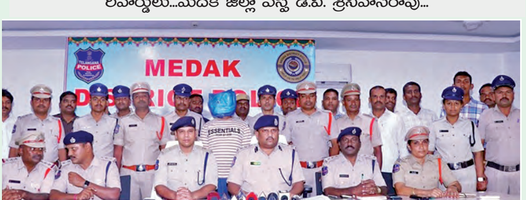
మీడియా సమావేశంలో నిందితుని ప్రవేశపెట్టిన పోలీసులు