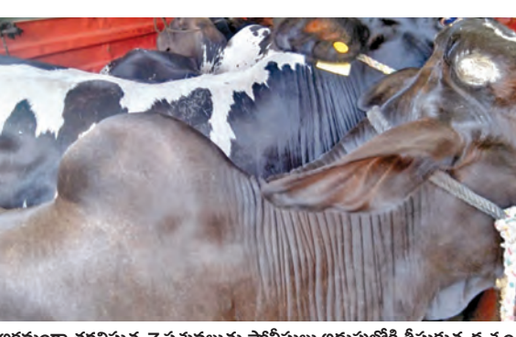
అక్రమం తరలిస్తున్న 7 పశువులను పోలీసులు అదుపులోకి తీసుకున్న డ్యూటీ

నార్కట్, మే 24, ప్రభాతవార్త : బల్లెడ వర్షాన్ని పురస్కరించుకుని కర్ణాటకలోని ఓడర్ పట్టణం నుంచి నిమోజనపర్ కేంద్రమైన జూలూరికి పట్టణానికి అక్రమంగా తరలించుతున్న 7 పశువులను అడ్డుకున్న సంఘటన ఆదివారం మధ్యాహ్నం చోటుచేసుకుంది. ఎన్ఐఎ డోమ నుజిత్ కత్తనం ప్రకారం...అక్రమంగా పశువులు (అవులు) తరలించడా జిల్లా ఎన్ఐఎ పరిశోధన పంకజ్ సూపనల మేరకు మండల పరిధిలోని గొంగూర్ వారస్తా జూలూరికి-బీదర్ రోడ్డుపై ప్రత్యేకంగా ఏర్పాటు చేసిన చెకపోస్టు గుండా వెళుతున్న కెం 38 ఎ 8231 వాహనంను ఆపి తనిఖీ చేయగా వాహనంలో 4 ఎడ్లు, 3 అవులు కావడంపైంది. పశువుల రవాణాకు సంబంధించి అక్రమం తరలిస్తున్న 7 పశువులను పోలీసులు అదుపులోకి తీసుకున్న డ్యూటీ