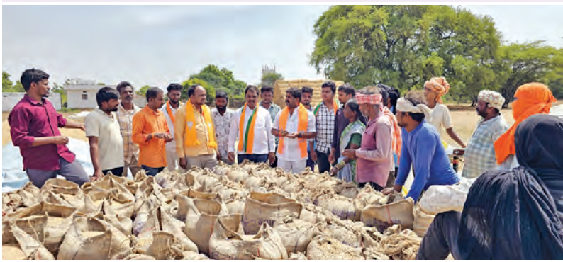
కొనుగోలు కేంద్రాలను పరిశీలిస్తున్న డ్యూటీ