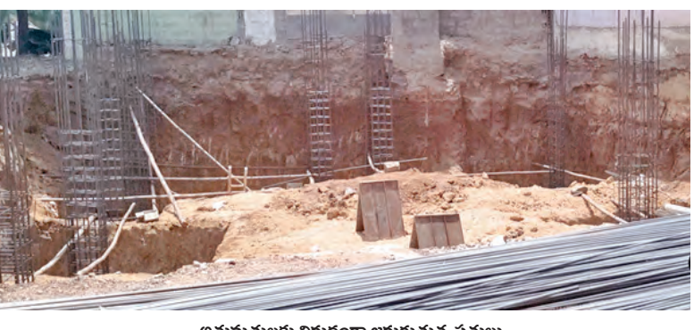
అనుమతులకు విరుద్ధంగా జరుగుతున్న పనులు