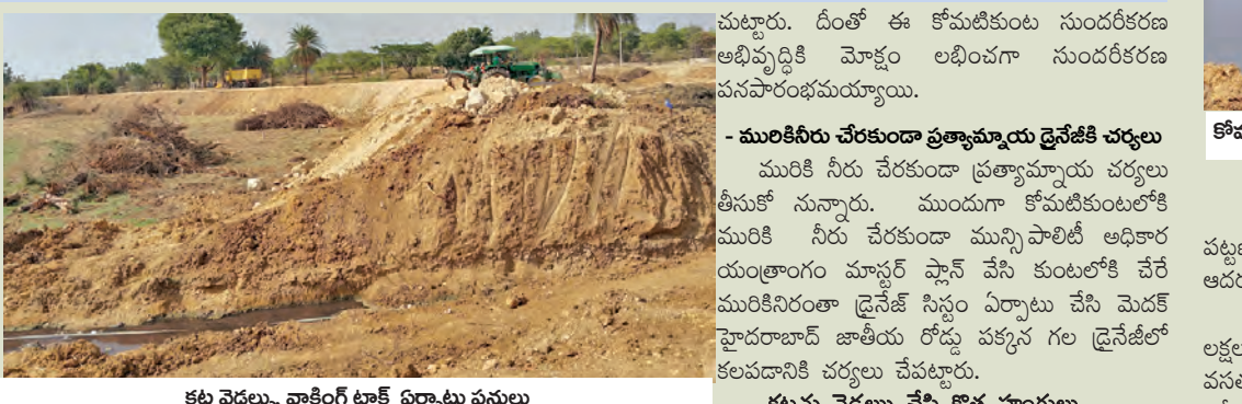
కట్ట వెడల్పు, వారికి ట్రాక్ ఏర్పాటు పనులు