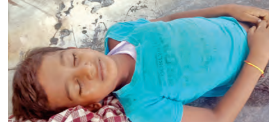
పాము కాటుకు గురైన బాలుడు తనిఖీ